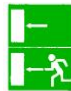
richting naar een

Bij de inschrijving ontvangen de ouders/verantwoordelijke van de interne de richtlijnen in geval van brand. De laatste bladzijde dient ingevuld terug aan het internaat bezorgd te worden.